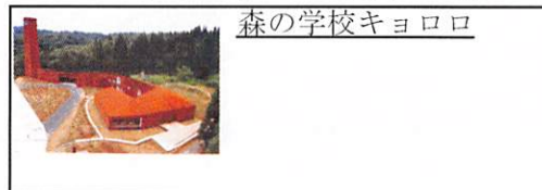
森の学校キョロロ